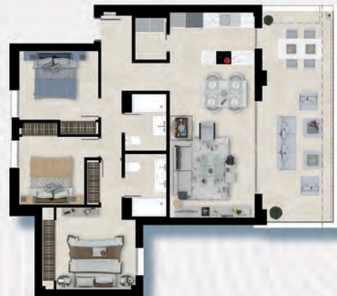
PRIMER PISO / FIRST FLOOR