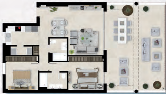
BAJOS / GROUND FLOOR