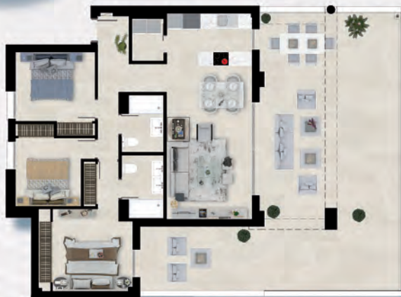
BAJOS / GROUND FLOOR