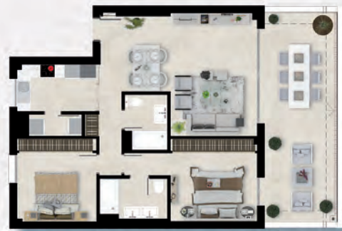
PRIMER PISO / FIRST FLOOR